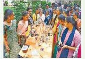
పీఠ నిర్ధారణ కళాశాలలో భాగీ మంటల చుట్టూ విద్యార్థినుల కోలాటం, బొమ్మల కొలువు.