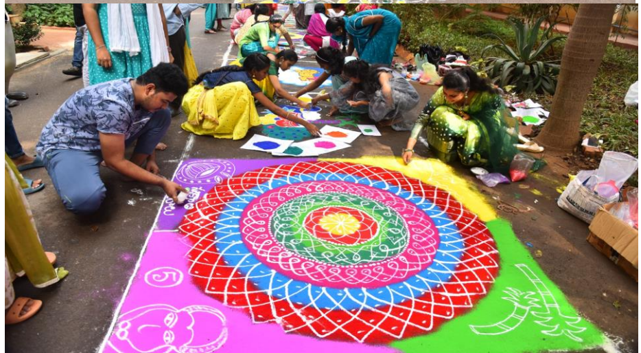
A holy fire eliminates darkness and illuminates goodness in our lives. Campus is adorned with colorful Rangolis.