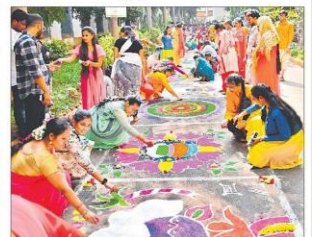
రంగవల్లుల తీర్చిదిద్దుతూ, విద్యార్థులు