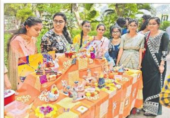
బొమ్మల కొలువుల వద్ద విద్యార్థులు